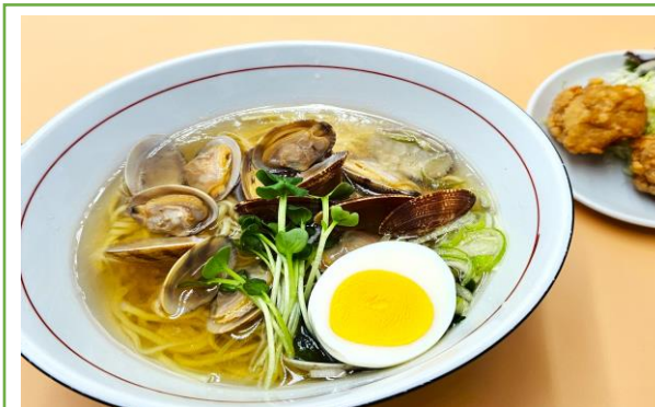
あさり塩ラーメン