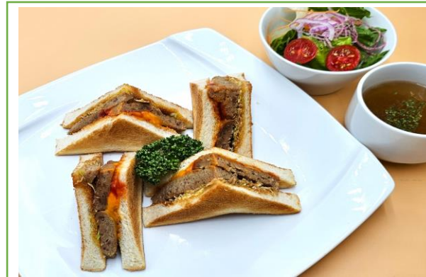
チーズハンバーグサンド