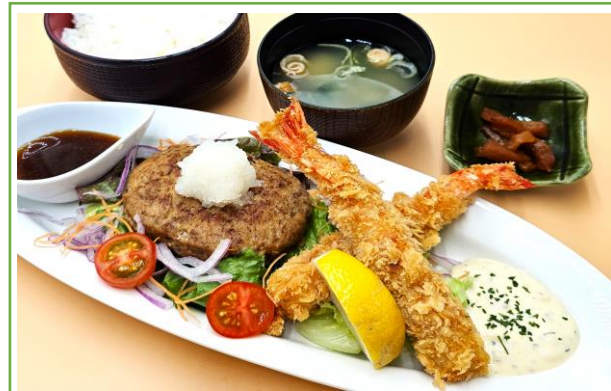
エビフライとハンバーグ