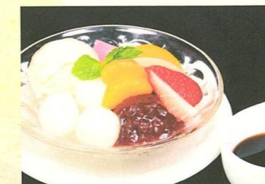
クリームあんみつ