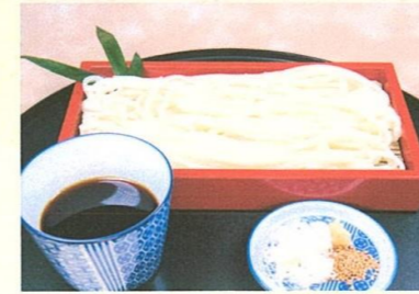
稲庭せいろうどん