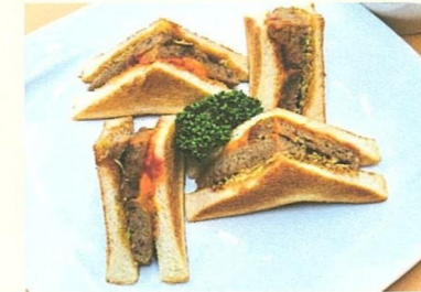
チーズハンバーグ