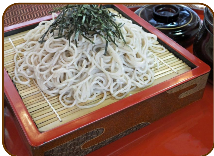
せいろ蕎麦・うどん ¥1,000